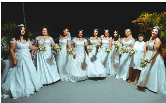
A iniciativa celebra o amor e garante a realização do sonho do casamento

objetivo possibilitar que famílias realizem o sonho do casamento, mesmo diante de dificuldades financeiras. Com o apoio de empresas parceiras e voluntários, os noivos contaram com trajes, decoração, cerimônia, recepção e alimentação, garantindo uma experiência única para eles, familiares e amigos presentes.