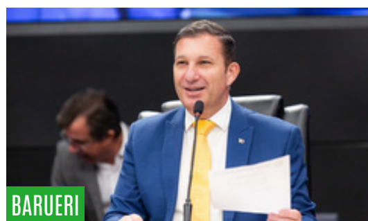
BARUERI Veredores aprovam reajuste para conselheiros tutelares de Barueri • PAG 5