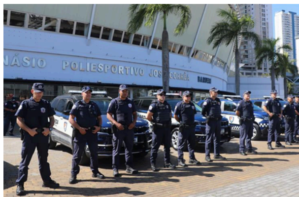
As operações seguem sendo realizadas continuamente em toda a cidade

A cidade de Barueri tem intensificado suas ações de segurança com a execução da Operação “Barueri Cidade Mais Segura”, iniciativa contínua da Secretaria de Segurança Urbana e Defesa Social (SSUDS) realizada em todas as regiões do município. Recentemente, a ação ocorreu nos bairros Jardim Belval e Parque dos Camargos, contando com cerca de 20 guardas municipais e 10